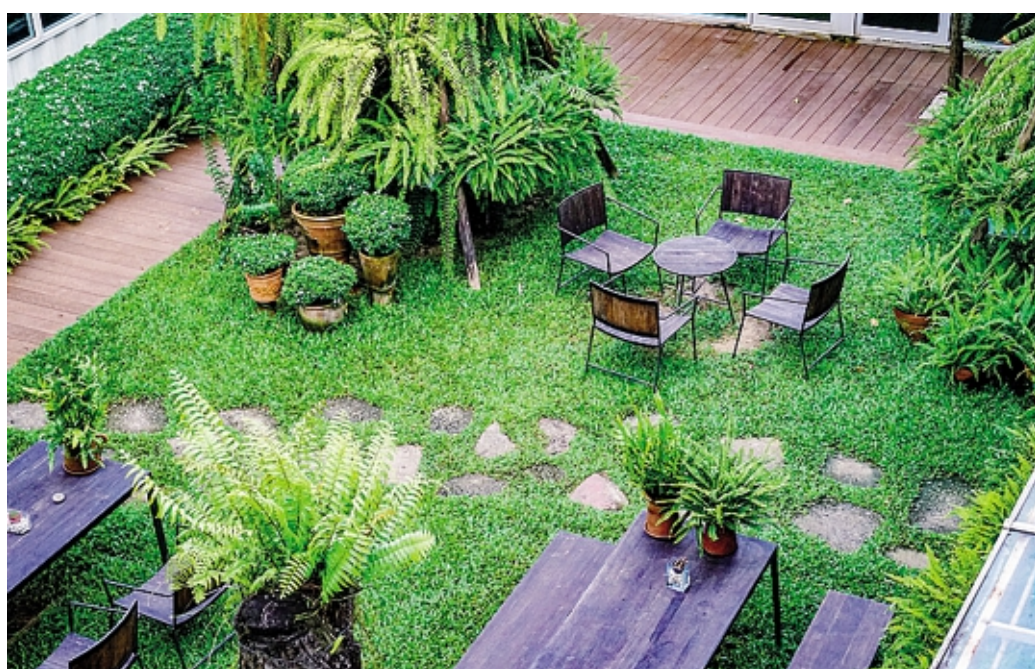
L'esposizione alla luce, la qualità del terreno e il microclima specifico influenzano le scelte

Nella progettazione di un piccolo giardino, ogni scelta deve essere ponderata per garantire che lo spazio sia non solo esteticamente gradevole ma anche funzionale. La selezione attenta delle piante e la scelta strategica degli arredi sono passi cruciali in questo processo. Qualche consiglio? Meglio optare per piante verticali e rampicanti che possono essere «guidate» su pergole o reti, creando splendide pareti verdi. Alberi nani o in forma di colonna offrono verde e ombra mantenendosi contenuti in spazio e dimensione. Riguardo ai mobili la parola d'ordine è praticità: le panche con spazio di stoccaggio integrato sono perfette per riporre cuscini o attrezzi da giardinaggio, mentre i tavoli pieghevoli liberano spazio quando non sono in uso. Infine per avere un giardino che offre spettacolo durante tutto l'anno, si a piante che cambiano aspetto con le stagioni. Ciò può significare fioriture in momenti diversi, foglie che cambia colore in autunno, o strutture interessanti in inverno. Un tocco di classe? Integrare l'elemento acqua. Non serve un ampio spazio per creare questo effetto: una piccola fontana o un bacino ornamentale possono fare meraviglie.